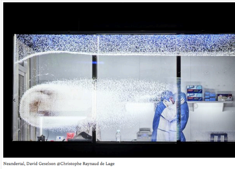
Neandertal, David Geselson

Posted by Yannai Plettener on mercredi, juillet 12, 2023 · Leave a Comment